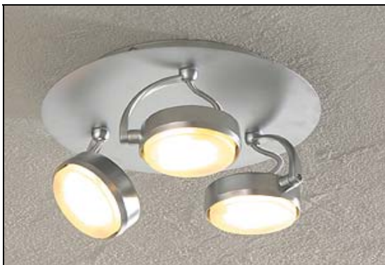
FOZZ PROFIL 3er Deckenleuchte

Die FOZZ PROFIL Decken- und Wandleuchten erinnern an kleine Scheinwerfer. Die drehbaren Lampenköpfe mit GX53 Energiesparlampen werden von einem geschwungenen Bügel gehalten. FOZZ Profil gibt es als 1er, 2er und 3er Deckenleuchten sowie als 2er, 3er und 4er Lichtschienen. Inklusive 9 Watt Energiesparlampen MEGAMAN GX53. UVP von 65 bis 246 Euro.