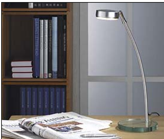
FOZZ OPUS Tischleuchte Foto MEGAMAN

Zu den schönsten Stücken im Programm gehört die Tischleuchte FOZZ OPUS. Die minimalistische Leuchte besteht aus einem Glasfuß, einem filigranen Metallschaft und dem flachen Lampenkopf. Er kann um 300 Grad gedreht werden, so dass FOZZ OPUS auch indirektes Licht abgibt. Die Tischleuchte ist 400mm hoch. In gleicher Ausführung gibt es OPUS auch als 1300mm hohe Steh-