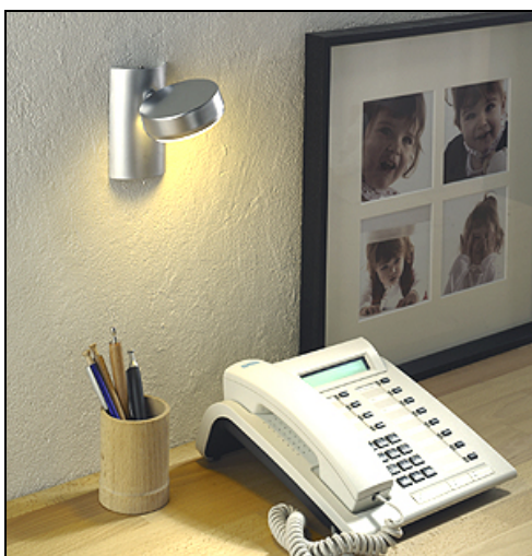
FOZZ SALSA Kurzarm Foto MEGAMAN

FOZZ SALSA überzeugt durch Vielfalt: Die 1er-Wandleuchten gibt es mit kurzem Arm, mit flexiblem Schwanenhalsarm und mit Gelenkarm. Die Lampenköpfe sind vielseitig drehbar. Inklusive 9 Watt Energiesparlampen MEGAMAN GX53. UVP von 75 bis 90 Euro. Die Gelenkarm-Version ist auch als 2er-Leuchte unter dem Namen OYA für 149 Euro im Programm.