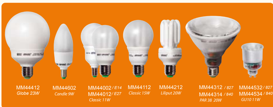
MM44412 Globe 23W MM44602 Candle 9W MM44002 / E14 MM44012 / E27 Classic 11W MM44112 Classic 15W MM44212 Liliput 20W MM44312 / 827 MM44314 / 840 PAR 38 20W MM44532 / 827 MM44534 / 840 GU10 11W